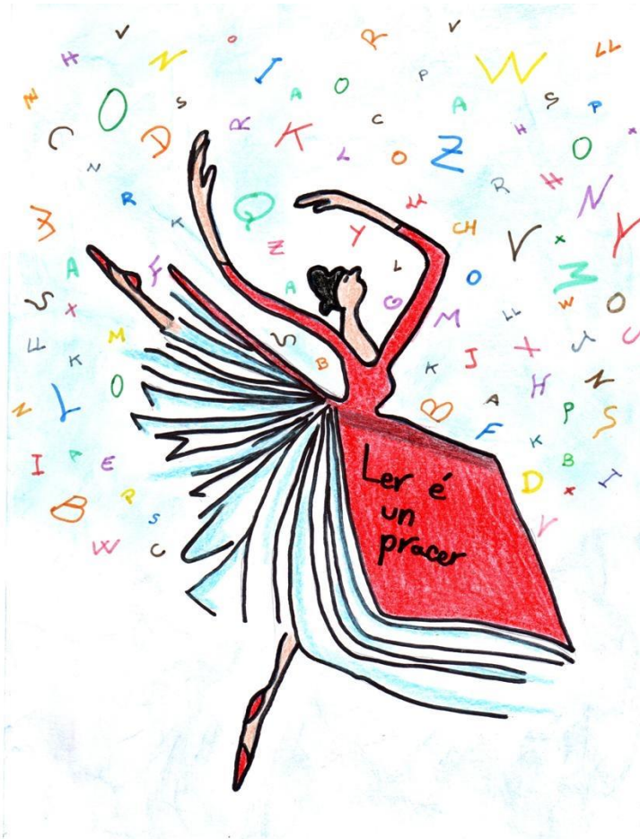
Ilustración de Yanira Fernández Ruiz (5º de primaria)